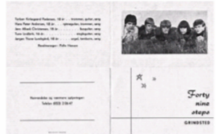
Gruppen Forty-nine Steps visitkort.

“SÅ VAR DER JO OGSÅ TUNE, DER MED SIN FENDER TELECASTER, SIT SORTE, LANGE HÅR OG DE HVIDE COWBOYBUKSER HAVDE NOGET MAGISK, MYSTISK OG DRAGENDE OVER SIG.